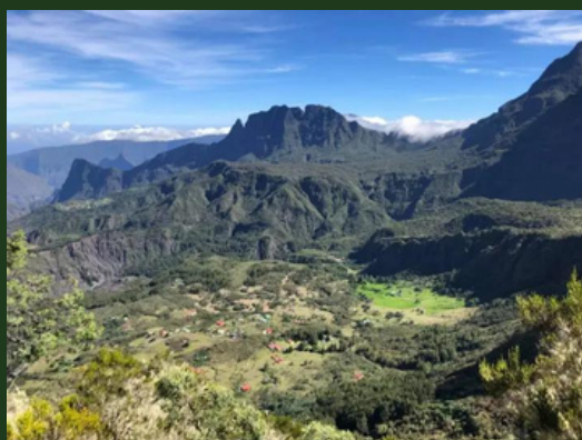
Col du Taibit

Nähern Sie sich nicht dem Rand des Wasserfalls: Die Felsen sind rutschig und instabil.