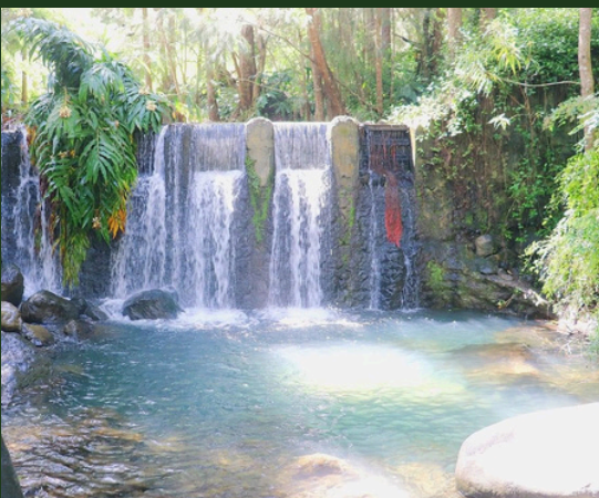
Die Alten Thermen

Fahren Sie auf der D241 in Richtung Bras Sec. Fahren Sie ca. 5 km mit dem Auto zum Kryptomeria-Wald. Nehmen Sie links die Richtung des Kervéguen-Wegs. Biegen Sie nach der Schranke sofort rechts ab. Die Ankunft ist neben dem Fußballplatz in Bras Sec. Sehr steiler